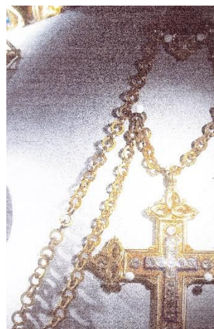
La Croix Pectorale, en or avec diamants.

Le 2 mars 1859, le P. Eymard prononça ses vœux religieux dans la Congrégation du Saint-Sacrement nouvellement fondée.